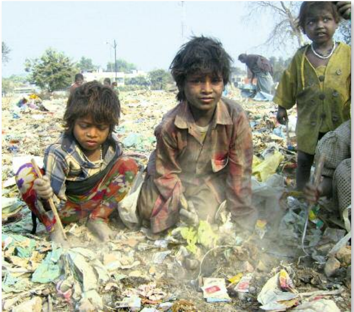
Uttar Pradesh, bevölkerungsreichster Bundesstaat Indiens: Kinder sammeln Müll, um zu überleben.

... oder Jugendliche, die sich in der Zigarettenindustrie das Zubrot für die Familie verdienen oder als Müllsammler unterwegs sind, um zu überleben – Facetten von Kinderarbeit, die gestoppt werden muss.