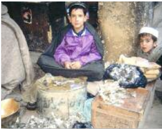
Kyberpass im afghanisch-pakistanischen Grenzgebiet: Kinder arbeiten als Opiumverkäufer.