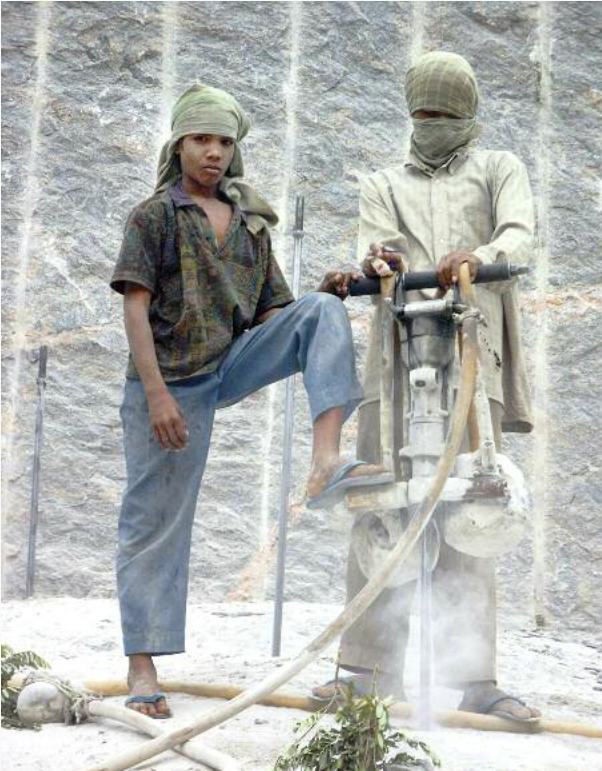
Südindien, Bundesstaat Tamil Nadu: Hier werden 20-Tonnen-Blöcke abgesprengt, die auch für Grabsteine in Deutschland verwendet werden.