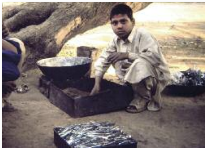
Pakistan: Junge produziert „surgical instruments“: Pinzetten und Scheren, die an Bahnhöfen in Deutschland verkauft werden.