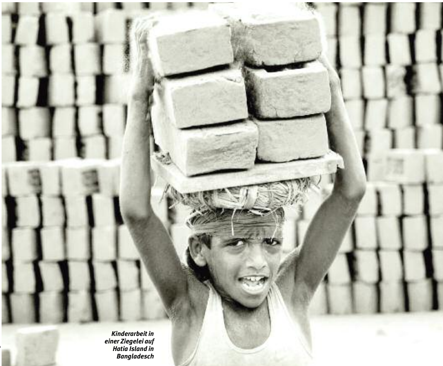
Kinderarbeit in einer Ziegelei auf Hatia Island in Bangladesch