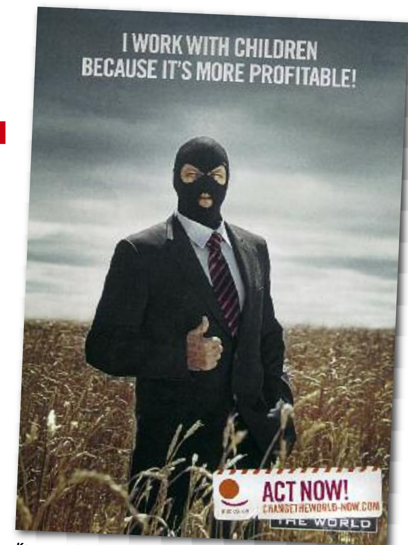
Kampagne des Internationalen Gewerkschaftsbundes

Der Kongress ist sich bewusst, dass der Kampf für die Beendigung jeglicher Kinderarbeit (...) unerlässlich für menschenwürdige Arbeit und ein menschenwürdiges Leben für alle ist und verschiedene Komponenten umfassen muss. Er soll sowohl eine sektorale Dimension und eine spezifische Strategie für die informelle Wirtschaft als auch eine für die Auseinandersetzung mit der Benachteiligung von Mädchen erforderliche ge-