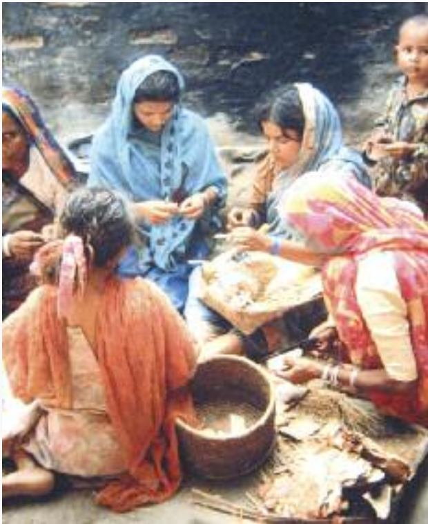
Indien: Zigarettenproduktion – die Kinder bekommen Lungenkrebs, ohne jemals geraucht zu haben.