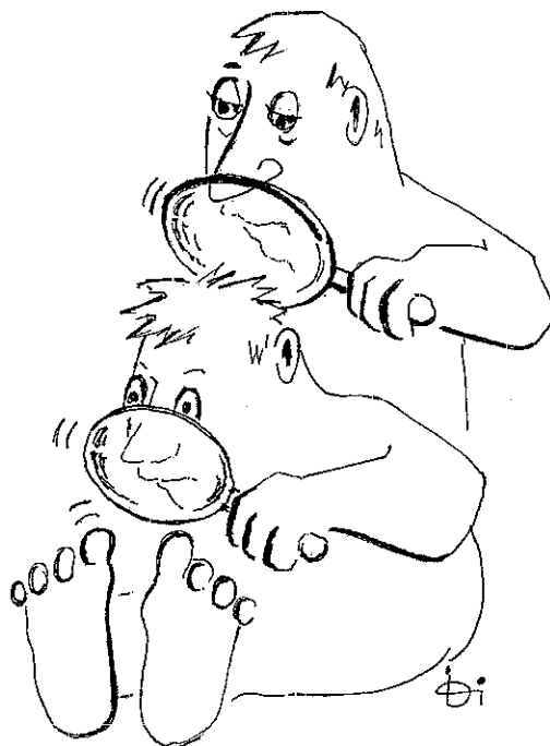
SEIS+ mit Peer Review

.... sind nach Meinung der AGAL hervorzuheben: Zwar ist zu begrüßen, dass der QR offensichtlich einen Lehrerberat bzw. eine Personalvertretung voraussetzt bzw. in das Audit involviert; letztlich scheint dessen Existenz jedoch keine Rolle bei der Zuerkennung des Gütesiegels zu spielen. Dies steht u.a. in einem eklatanten Widerspruch zu den sonstigen Kriterien, die z.B. einen demokratischen Unterrichtsstil voraussetzen. Wie sollen dies LehrerInnen leisten, die selbst in autoritäre Strukturen eingebunden sind? Weiter erscheint fragwürdig, dass die Aussagen zu den Unterrichtsprogrammen und -projekten etwa zur Demokratieerziehung, Gewalt- und Konfliktprävention sowie zur Konfliktlösung allein auf deren Vorhandensein abheben, ohne dass Deskriptoren zur Qualität und zum Umfang derselben hinzukämen. Ferner muss das Auslandsschulwesen in dieser Zeit seine Legitimation auch aus einem nachhaltigen Beitrag zur Friedenssicherung beziehen. Dieser muss über die Grenzen der Schulgemeinschaft hinausweisen, indem er z.B. die Gegensätze innerhalb multikultureller Gesellschaften bzw. zwischen den Kulturen thematisiert. Ein solcher Beitrag wird in dem vorliegenden QR nicht gefordert.