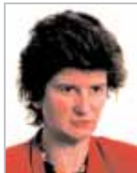
Eva-Maria Stange, Vorsitzende der Gewerkschaft Erziehung und Wissenschaft