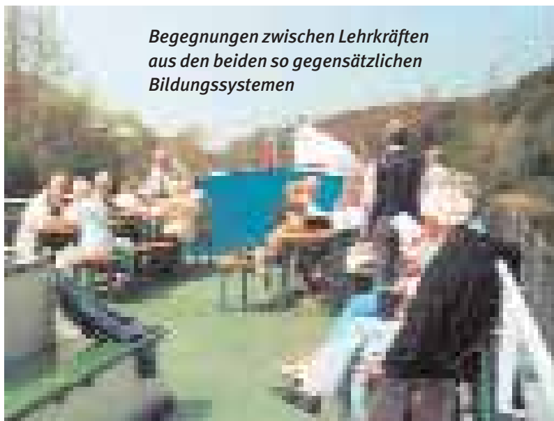
Begegnungen zwischen Lehrkräften aus den beiden so gegensätzlichen Bildungssystemen

Als die Mauer fiel und als sich Menschen aus Ost und West gegenseitig in die Arme fielen, da gab es auch Begegnungen zwischen Lehrkräften aus den beiden so gegensätzlichen Bildungssystemen.